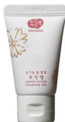
Čisticí pěnový gel