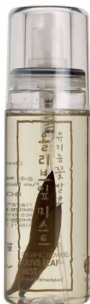
Olivová mlhovina, 80 ml, 1025 Kč

Miluji italskou bytovou vůni Purotatto. Pocit čerstvě vypraného prádla a květin jarní louky zanechá nezaměnitelnou vůni na oblečení. Prodáváme svíčku, parfém, difuzér a mydlo. Já mám nejraději parfém, protože je velmi variabilní, nedá se snad nikdy spotřebovat a beru si ho s sebou i na cesty.