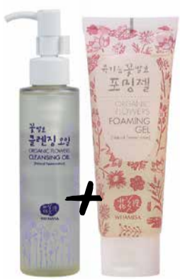
-1950 Kč - nová cena 1685 Kč