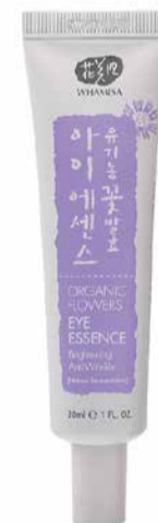
Oční krém, 30 ml, 1445 Kč

Mám velmi citlivé oční okolí a WHAMISA Oční krém je první v mém životě, který mi opravdu viditelně vyhlazuje vrásky. Obsahuje mou oblíbenou látku adenosin, což je silný antioxidant, který zvyšuje tvorbu kolagenu a tím redukuje vrásky. Funguje na všechny typy pleti.