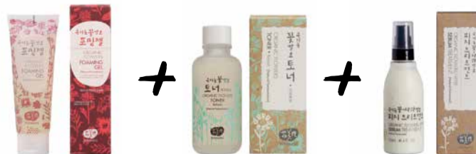
-3105 Kč - nová cena 2485 Kč

Nabídka platí do 30. 9. 2018 nebo do vyprodání zásob.