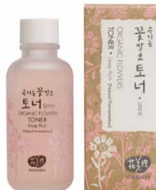
Tonikum Deep Rich, 120 ml, 1315 Kč

Jsem často na cestách a jsem šťastná za naše cestovní verze produktů. V letních měsících nikdy neodjízdim bez MINI Čisticího gelu, Tonika Deep Rich, Lotion Double Rich.