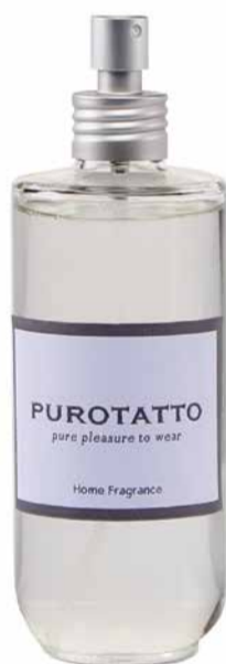
Parfém Purotatto, 200 ml, 1590 Kč

Miluji italskou bytovou vůni Purotatto. Pocit čerstvě vypraného prádla a květin jarní louky zanechá nezaměnitelnou vůni na oblečení. Prodáváme svíčku, parfém, difuzér a mydlo. Já mám nejraději parfém, protože je velmi variabilní, nedá se snad nikdy spotřebovat a beru si ho s sebou i na cesty.