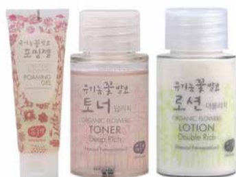
Cestovní sety za zvýhodněné ceny na www.puredistrict.cz

Jsem často na cestách a jsem šťastná za naše cestovní verze produktů. V letních měsících nikdy neodjízdim bez MINI Čisticího gelu, Tonika Deep Rich, Lotion Double Rich.