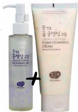
-2210 Kč - nová cena 1885 Kč

CHCETE POPRVÉ VYZKOUŠET WHAMISU A NEVÍTE ČÍM ZAČÍT? VSAĎTE NA ČIŠTĚNÍ! DÍKY SPECIÁLNÍ PROMO AKCI MÁTE NYNÍ JEDINEČNOU PŘÍLEŽITOST SI JI NA SOBĚ VYZKOUŠET.