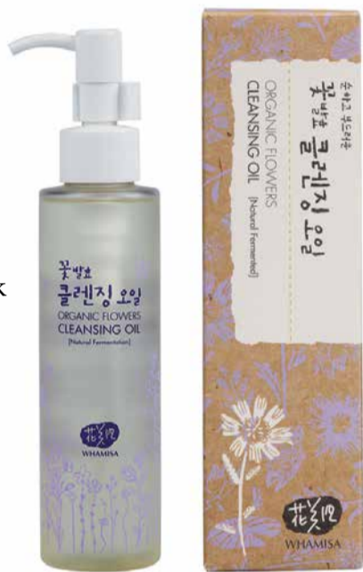
150 ml, 1105 Kč

Ač to možná bude znít nelogicky a i když není potřeba odstranit make-up, je nutné i ráno zbatvit se kožního mazu a potu. Doporučujeme aplikovat pár kapek oleje přímo na ruce a jemně rozetřít po celé tváři. Poté přidat trochu vody a vytvořit emulzi, která lze jednoduše smýt teplou vodou.