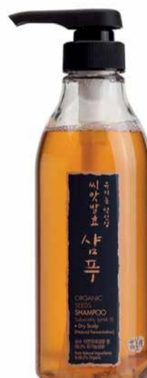
Šampón pro suchou pokožku hlavy, 500 ml, 1305 Kč, Kondicionér 300ml, 1205 Kč

V parných dnech se nejlépe osvěžím mlhovinou. Skvěle fixuje make-up a já si ji stříkám doslova na celé tělo. Ačkoliv miluji vůni růží, používám Olivovou verzi. Je vhodnější na suchou pokožku a nic lepšího na hydrataci jsem v životě neměla!